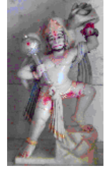
வட நாட்டில் இரு ஆலயங்களில் உள்ள அனுமான் சிலைகள்