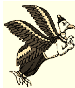
கிராம தேவதைகள் , பூதகணங்கள் , மற்றும் மாயா ஆவிகளின் தோற்றம்