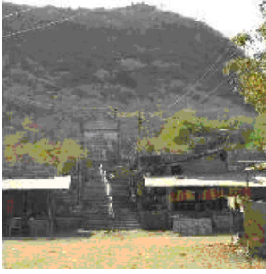
ஆஷா மாதா ஆலயம் உள்ள மலை

(ஆன்மீக ஆலயம், ஏப்ரல், 2008 இதழில் வெளியான இந்த கட்டுரையின் விரிவாக்கப்பட்ட மறு பதிப்பு இது )