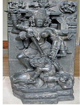
தூர்கையின் ஒரு சிலை

ஆலயம் செல்லும் வழி: கர்னாடகாவில் உள்ள மங்களூரில் இருந்தும் (சுமார் 30-35 கி.மீ) உடுப்பி (சுமார் 35-40 கி.மீ) அல்லது தர்மஸ்தலாவில் இருந்தும் கடில் ஆலயம் செல்ல நேரடி பஸ் வசதிகள் நிறைய உள்ளன.