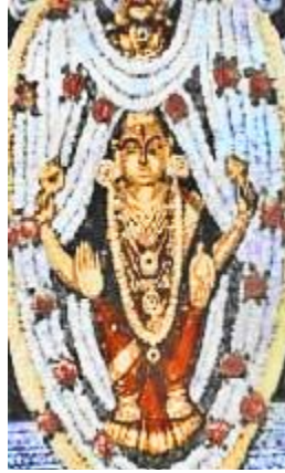
கடில் தூர்கா மா