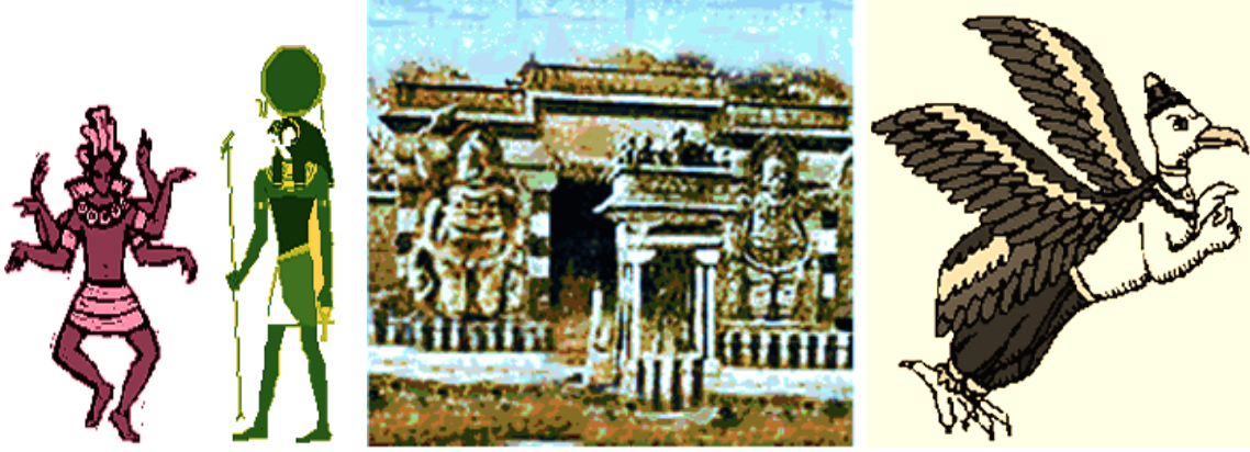
கிராம தேவதைகள், பூதகணங்கள், மற்றும் மாயா ஆவிகளின் தோற்றம்

கிராமங்களில் அவர் சிலைகள் உள்ளன. மாபெரும் வீரனான அவர் ஒரு மன்னனால் வஞ்சகமாகக் கொல்லப்பட்டார் எனவும், அவருடைய ஆவி மரணம் அடையாமல் மாலையில் அந்தி நேரத்தில் ஒரு குதிரை மீது ஏறி நகரில் ஊர்வலமாகச் செல்லும் எனவும், அந்த நேரத்தில் அவர் ஊருக்குள் நுழையும் தீய ஆவிகளை அடித்து விரட்டுவார் எனவும் நம்பிக்கை உள்ளதினால், அவரை ஆராதிப்பதின் மூலம் அவர் அந்த கிராமத்தைப் பாதுகாத்து வருவார் என நம்பினர். ”